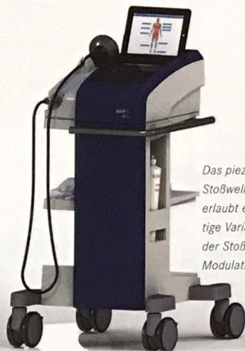
Das piezoelektrische Stoßwellenprinzip erlaubt eine einzigartige Variabilität der Stoßwellen-Modulation.

Die Stoßwellentherapie ist aus der modernen Medizin kaum noch wegzudenken: Entwickelt zur Nierensteinerzürümmung, hat sie sich mittlerweile fest etabliert bei Erkrankungen des Muskel-Skelett-Systems in der Orthopädie (z.B. beim Fersensporn) sowie bei Hauterkrankungen (z.B. schlecht heilenden Wunden). Relativ neu ist die Anwendung bei urologischen Erkrankungen: so zeigt sie insbesondere bei Erektionsstörungen große Erfolge. Als eine der ersten Praxen in Deutschland bietet die Urologie Groß-Gerau dieses innovative Verfahren ihren Patienten an.